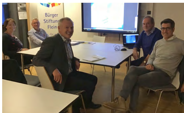
Im Gespräch mit der Bürgerstiftung in Flein

die Bürgerstiftungen in unseren Gemeinden sind vielerorts Spiegelbild des bürgerschaftlichen Engagements. Die Heilbronner Bürgerstiftung unterstütze ich deshalb gerne als Mitglied des Stiftungsrats. In den vergangenen Wochen habe ich mich mit Repräsentantinnen und Repräsentanten der Bürgerstiftung in Nordheim, Talheim und Flein getroffen. In allen drei Stiftungen setzen sich die Men-